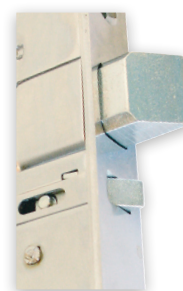
STEP 29 Silent kan ta utskjutande fallkolvlar på upp till 20 mm.