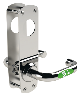
Velg mellom flere forskjellige STEP Exit rømningsbeslag i Exitguiden på steplock.no

FreeDrive®-teknikken frikobler motoren og girboksen, noe som betyr at de aldri påvirkes av bruk av nødutgangsbeslaget. Slitasje på motor og girboks minimert – selv om beslaget benyttes hyppig gjennom hele dagen.