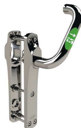
Velg mellom flere forskjellige STEP Exit rømningsbeslag i Exitguiden på steplock.no