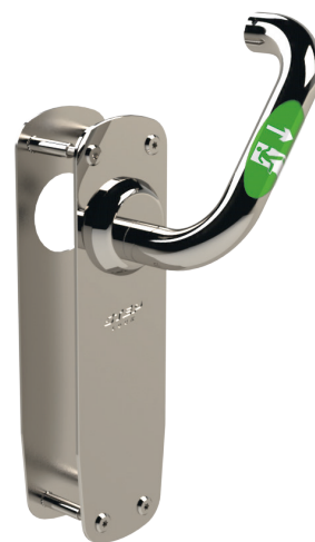
Välj mellan flera olika STEP Exit nödutrymningsbeslag i Exitguiden på steplock.se